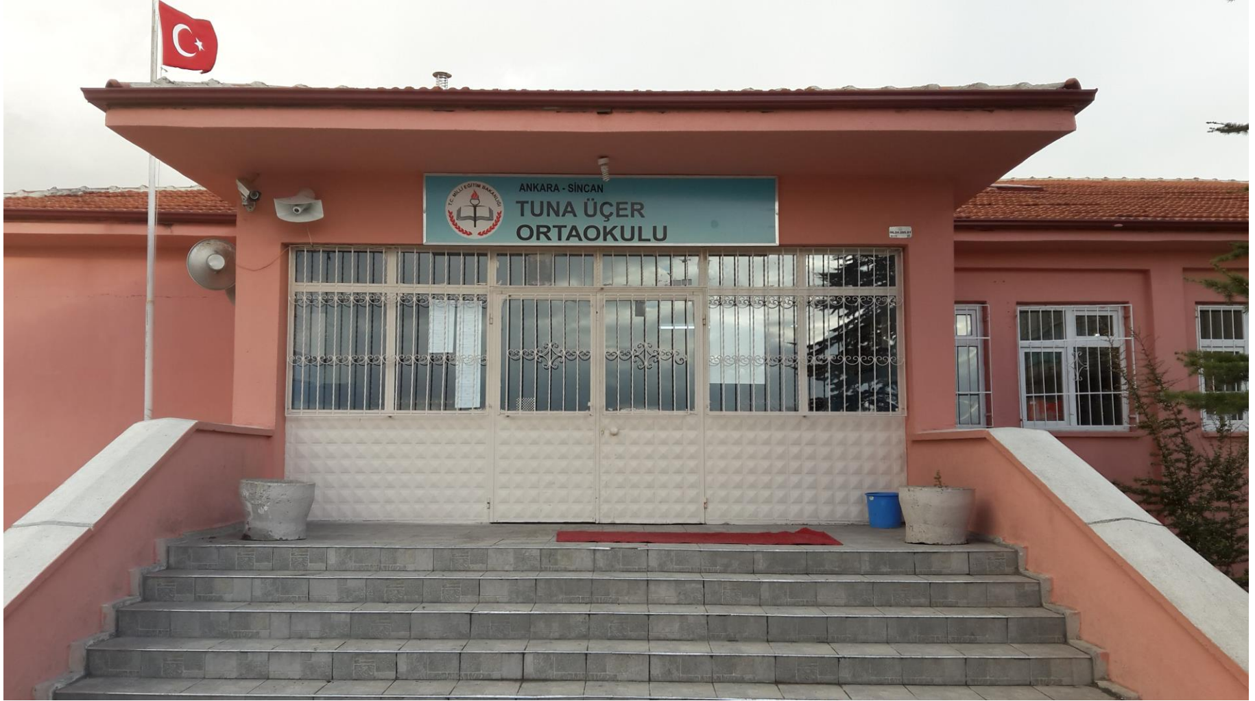
TUNA ÜÇER ORTAOKULU